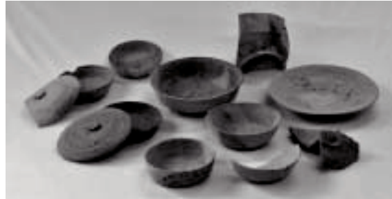
南田原条里遺跡 出土土器

平成30年度に実施した発掘調査の中から、奈良時代の大きな掘立柱建物跡が発見された南田原条里遺跡(吉田)や弥生時代と奈良時代の溝が見つかった中溝遺跡(駅前)、平成30年度に新たに遺跡として確認された上坂遺跡(辻川)など町内各地の調査成果について紹介します。