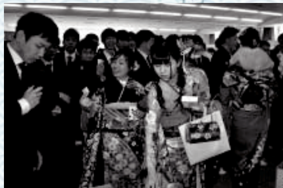
アトラクションのようす