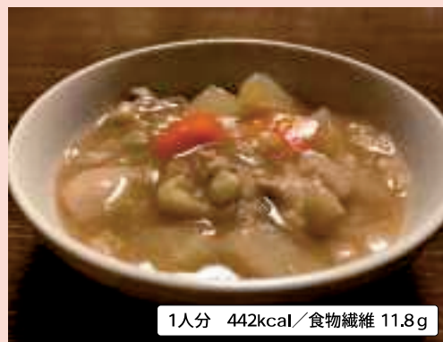
1人分 442kcal/食物繊維 11.8g