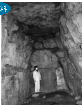
神崎郡内でも最大の石室空間をもつ妙徳山古墳