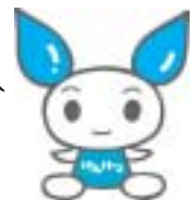
献血キャラクター 「びびちゃん」

200mL献血は当日の必要数が確保できた時点で受付を終了し、その後は400mL献血のみ受付します。