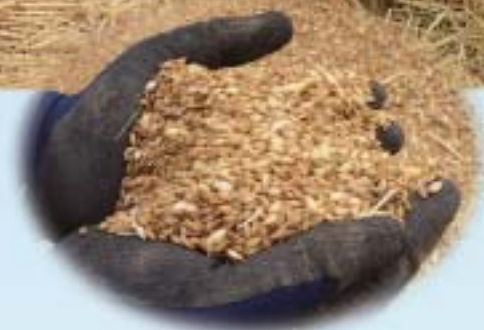
「新品種 フクミファイバー」

新型コロナウイルス感染症の感染拡大防止のため、お知らせしているイベントを中止したり、施設を閉館する場合があります。事前に担当課に問い合わせるか、ホームページなどでご確認ください。