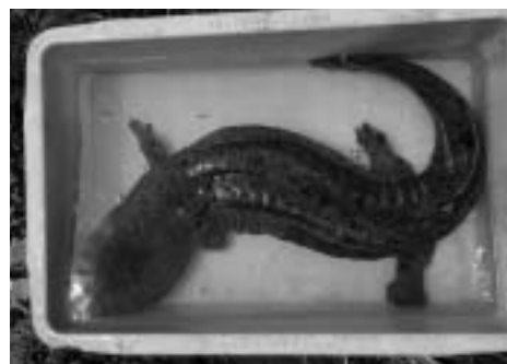
5月に山崎の用水路で確認されたオオサンショウウオ