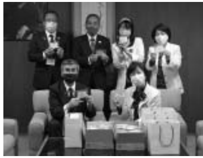
福崎サルビアライオンズクラブのみなさん

いただいたマスクは、医療や介護の現場を優先に、大切に使用させていただきます。ありがとうございます。