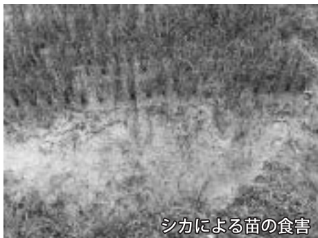
シカによる苗の食害

近年、イノシシ、シカ、アライグマなどの野生動物による農作物への被害が増加しており、福崎町では、獣害対策の一つとして、猟友会に有害鳥獣の駆除を依頼しています。