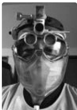
コロナ対策も万全です

「歯を抜いてもらうつもりで、何日か前から血がサラサラになる薬を飲むのをやめて来ました。」という患者さんが時々おられます。18年前それは正しかったのですが、現在では血がサラサラになる薬を休薬して抜歯することは非常に危険とされています。