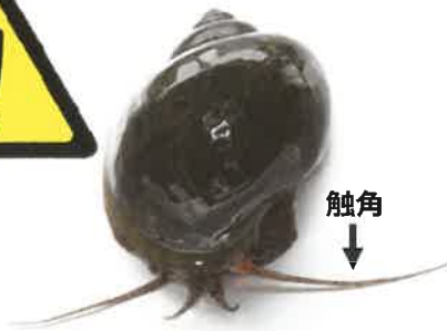
ジャンボタニシ (スクミリングガイ)