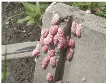
用水路（水口）の卵塊