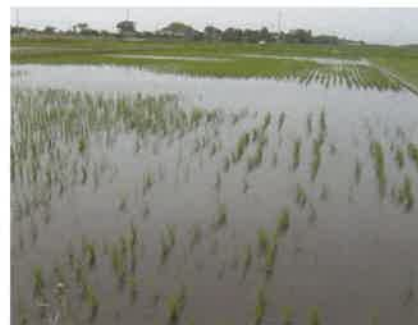
食害を受けた水田