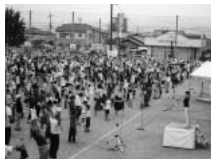
50周年記念(平成18年)ラジオ体操会のようなす(田原小学校)