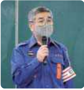
福崎町消防団退団式であいさつをする町長