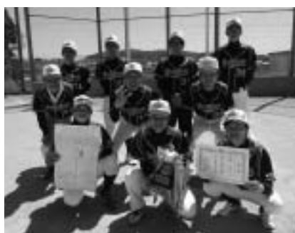
八千種SCのみなさん