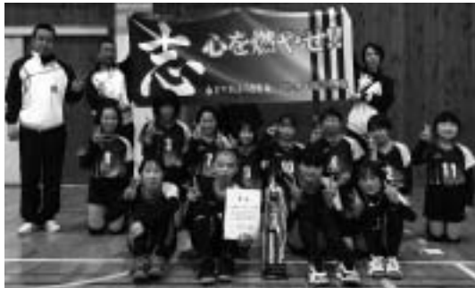
FVBふくさきのみなさん