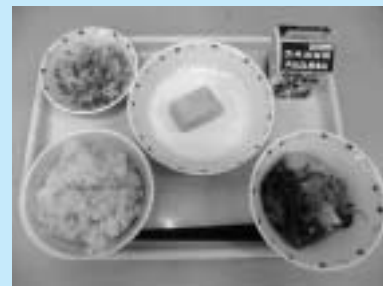
もちむぎごはん給食 (米澤モチ2号)