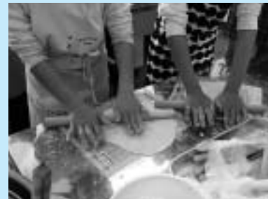
麺打ち体験 (フクミファイバー)