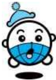
国保キャラクター・コクコン