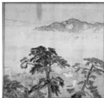
「住吉詣(右隻・左隻)画稿」(柳田國男・松岡家記念館蔵)