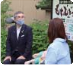
「はりまサタデー9」インタビュー

新型コロナウイルスワクチン接種は現在、基礎疾患を有する方の予約受付を行っています。ただ、基礎疾患がある方を町では把握できませんので申し出が必要です。基礎疾患自己申告