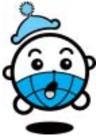
国保キャラクター・コクコン