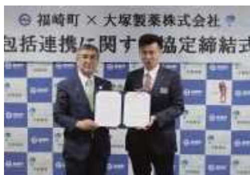
尾崎町長(左)と吉田支店長