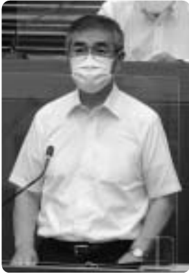
第499回福崎町議会定例会

新型コロナウイルスの感染防止対策は、3密を避ける、マスクの着用、手指消毒です。みなさんの大切な家族を守るためにも、ご協力をよろしく願います。