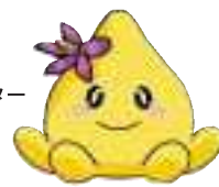
福崎切り花部会 イメージキャラクター ツノっちー

ツノナスをつくってみませんか？ 福崎の秋を彩るツノナス。今年は、8月の長雨に悩まされ少し小ぶりではありますが、色つき始め旬菜蔵で販売しています。