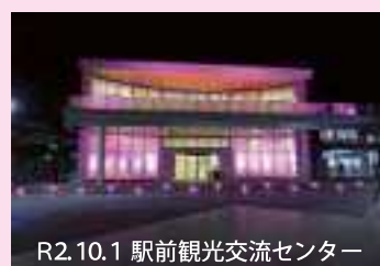
R2.10.1 駅前観光交流センター

乳がんの早期発見・早期診断・早期治療の大切さを伝えるために、キャスルウォークを開催します。みんなで歩きながら乳がんについて考え、周囲の方々に検診の大切さを伝えましょう。