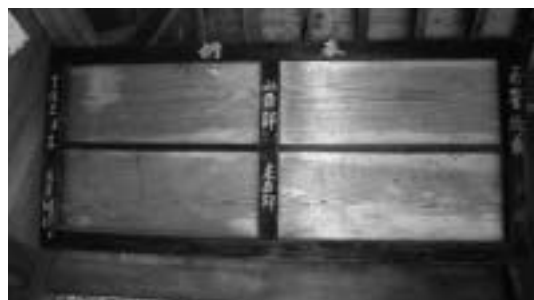
西谷大歳神社の俳諧額（天保11年）