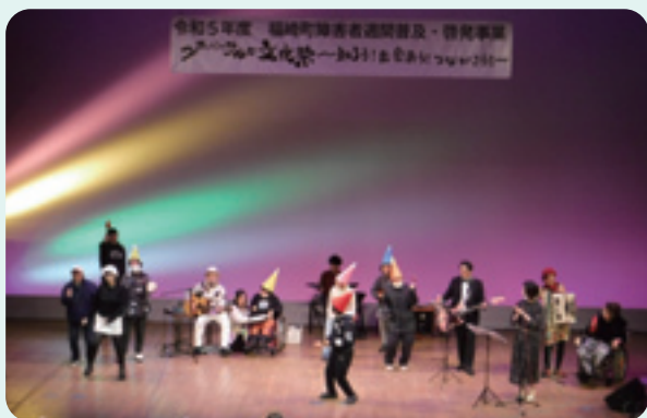
12月3日 ユニバーサルな文化祭