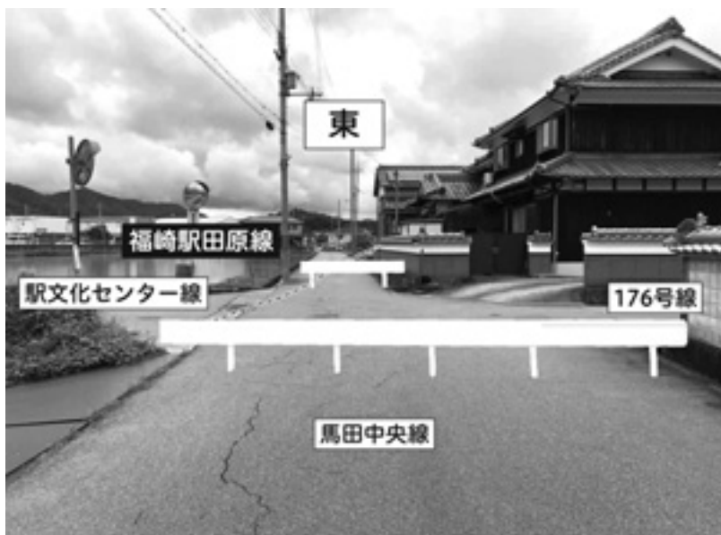
福崎駅田原線 イメージ図