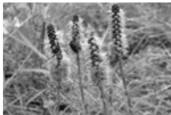
ミストラノオ 播磨植物図鑑 中播磨県民センター 2016

8月から10月に開花し淡い紫色の花をつけます。絶滅のおそれのある野生動植物をリストアップした兵庫県版レッドデータブック2020に掲載されており、兵庫県ランクはBランク、環境省ランクは絶滅危惧2類に該当しています。県内では福崎町のほか7市町に分布しており、減少傾向にあります。