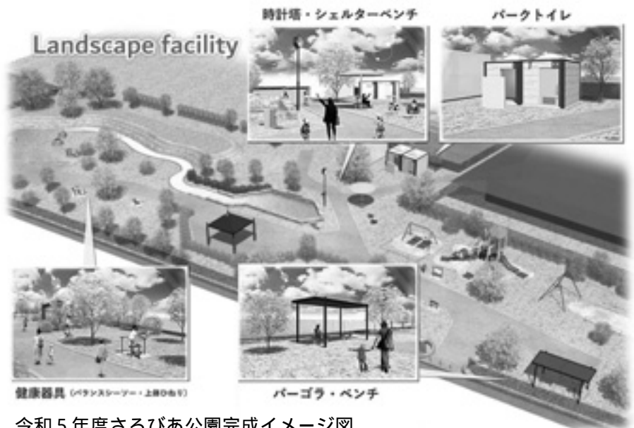
令和5年度さるびあ公園完成イメージ図

公募型プロポーザル方式で業者が決定し、来年度から使用できるよう工事を行っています。