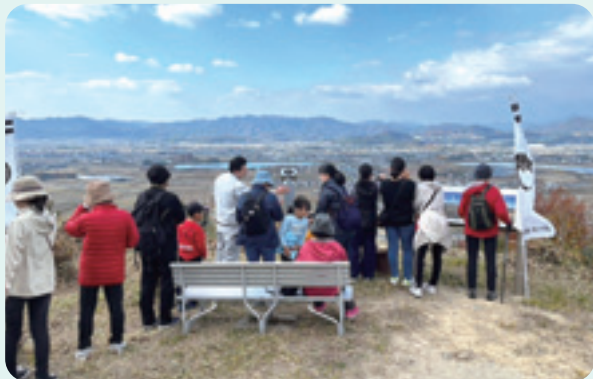
12月3日 いざ登らん！春日山城！