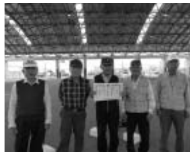
新町GG同好会のみなさん