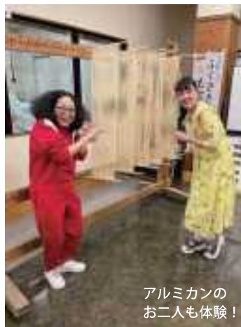
アルミカンのお二人も体験!