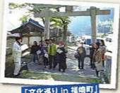
「文化めぐりin福崎町」町内神社巡り