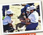
「大地に埋もれた歴史」火起こし体験

福崎町では、「まちづくり出前講座」を開講し、町民のみならず、子どもや外国人観光客など、幅広い層の方々が「大地に埋もれた歴史」「文化めぐりin福崎町」で町内の文化財の魅力を楽しんでいます。また、町内の小学5-6年生を対象とした「ふくさき歴史体験講座」でも、勾玉づくりや拓本体験などを通して、楽しみながら文化財に触れる機会としています。ぜひともご活用いただき、地域の歴史・文化に触れてみてください。