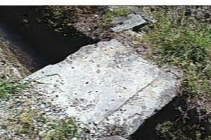
大塚古墳北の石棺

市川の流路を見下ろす段丘上に築かれています。墳丘は一部崩れていますが、石室はほぼ完存しており、構造を観察することができます。出土遺物は須恵器の提瓶が知られています。また、古墳北側に用水路の橋として転用されている組み合わせ式石棺の蓋石が確認できます。