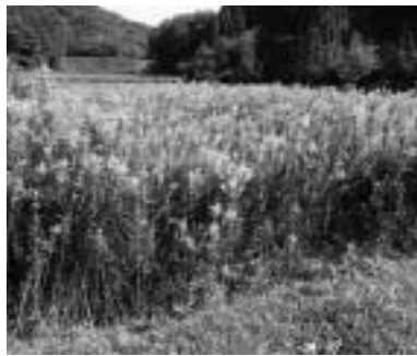
セイタカアワダチソウ

付くこともあり、解消に多大な労力がかかります。 農地の所有者及び耕作者には、農地を適正に管理する責務があります。夏場は、雑草等の成長が早くなり、病虫害や鳥獣被害も発生しやすくなりますので、早めに草刈り等の管理を行い、近隣の迷惑にならないようにしましょう。