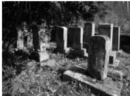
尾芝家墓所（加西市菊ヶ谷墓地）