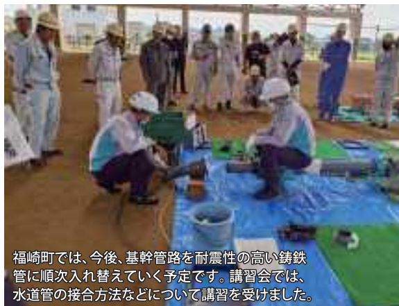
福崎町では、今後、基幹管路を耐震性の高い铸铁管に順次入れ替えていく予定です。講習会では、水道管の接合方法などについて講習を受けました。

6月20日、水道週間の取り組みの一つとして、さるびあドームで水道技術講習会が開催されました。