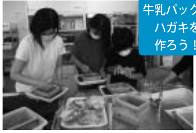
牛乳パックでハガキを作ろう！

日 時 8月23日(水) 13:30～ 場 所 生活科学センター 対 象 小学生及び保護者 (4年生までは必ず保護者同伴) 講 師 福崎町消費者の会 参 加 費 100円 申 込 期 間 8月18日(金)まで 持 参 物 筆記用具、水筒、上靴 申 込 先 生活科学センター ☎22-2939 (月曜日休館)