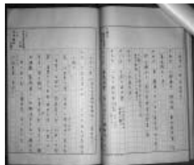
「東京渡遊中日記摘要」（個人蔵）

操は、東京見物をしたり、いろいろな人と面会したりと、東京滞在中を楽しんでいたようです。