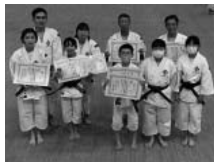
少林寺拳法協会のみなさん