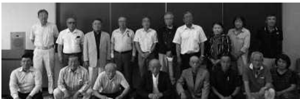
農業委員会事務局（農林振興課内・内線314・315）

農地の貸し借りや売買、農地転用など農地に関する相談は、お気軽にお近くの農業委員、農地利用最適化推進委員までご相談ください。