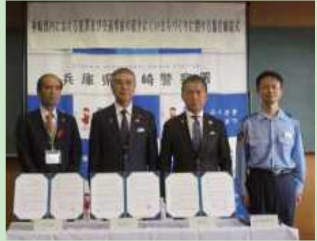
（写真左から）津田市川町長、尾崎福崎町長、山名神河町長、竹迫福崎警察署長