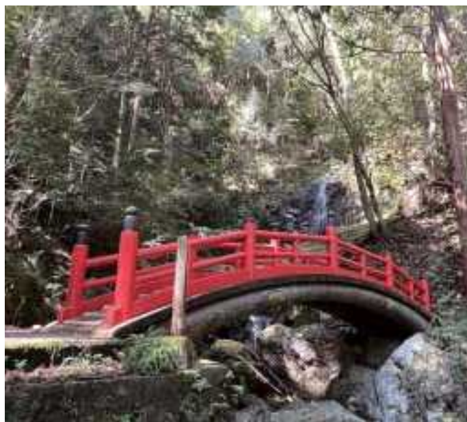
鮮やかな朱色に塗り替えられた太鼓橋。秋の行楽シーズンに七種山登山をぜひお楽しみください。