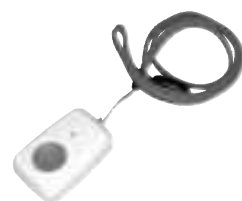
ペンダント型送信機