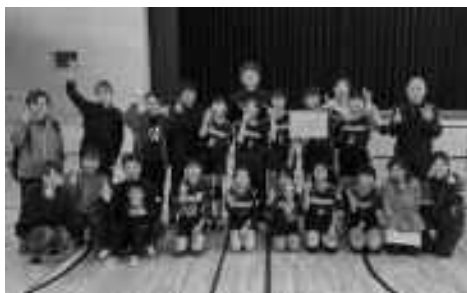
田原SCバレーボール部のみなさん