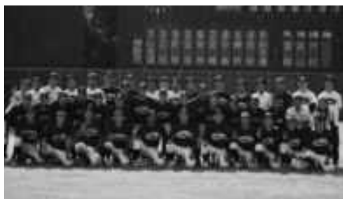
野球部のみなさん

【女子バスケットボール部】 ●関西女子学生バスケットボ ールリーグ戦 3部リーグ 優勝