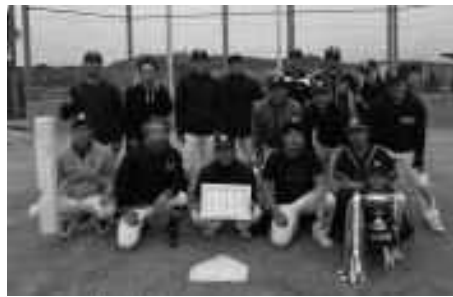
優勝 余田のみなさん