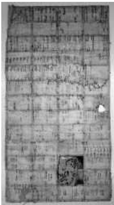
傷んだ部分だけが張り替えられている下張り

なお、こうした焼け焦げができた場合や、何かぶつかって破損したといった場合でも、下張り全体を張り替えるのではなく、傷んだ部分だけを切り取って張り直す、という方法がとられたようです。