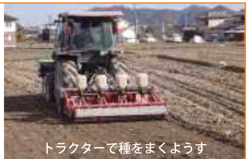
トラクターで種をまくようす

令和6年産もち麦の種まきが11月に行われました。田を耕し、溝を作って水はけを良くしてから種をまきます。種をまいてから10日から2週間ほどで芽が出てきます。これから冬を越し、春を過ぎて、6月の収穫まで大切に育てていきます。（農林振興課）