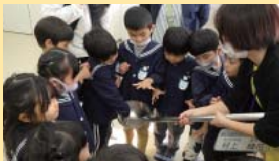
お玉だってこんなに大きい!