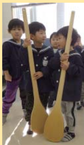
ししゃもじと背くらべ 「わぁ大きい!」