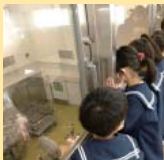
大きな釜で作っているね