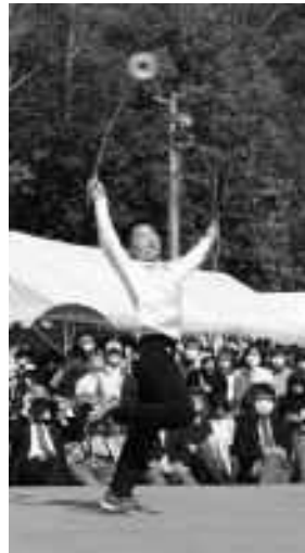
昨年のようす (ステージイベント・ 出店・紙芝居など)