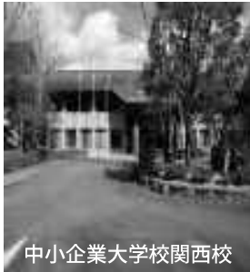
中小企業大学校関西校

関西校は移転しますが、中小企業の皆様 のいろんなご要望にお応えするために福崎 町商工会館内に エリアマネー ジャーを配置さ れます。人材育 成などのご相談 があればご利用 いただきたいと思います。