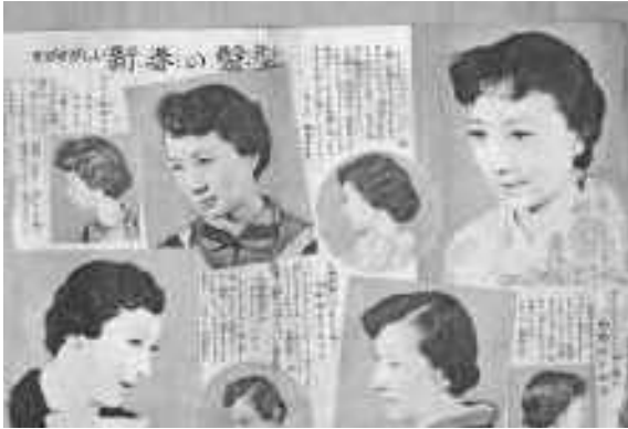
年別理髪料金一覧表

大正時代に日本で登場したパーマは、戦後再び流行しました。タイムス紙面でも郡内48店の美容院・理髪店の広告が掲載されました。福岡地域の店舗においては28店が掲載され、うち14店は新規開店案内の広告で、流行した様子がかがえます。