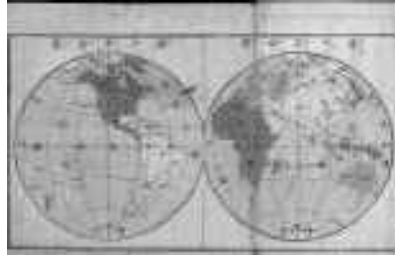
福沢諭吉著『 せかいにつくし 世界国尽』