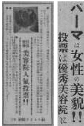
美容院人気投票!! 昭和26年9月25日発行

昭和26年には、神崎郡内のパーマネット美容院の人気投票が行われました。主催した神崎タイムス紙面に投票用紙が印刷され、約二か月半にわたって競い合い、白熱した様子は記事でも報じられました。結果は、一万三千五百五十票を得て、オリオン美容室（新町）が一位となりました。当時、パーマは着物と洋服のどちらにも合う髪型として人気を集めていたようです。