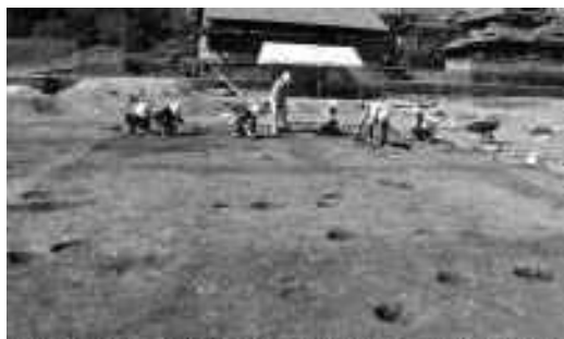
観音堂遺跡での発掘調査