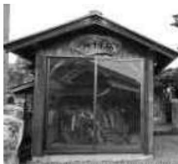
千年松の切り株（八反田区）

方々の手により覆い屋がか けられて保存され、被害の大 きさを私たちに教えてくれ ています。