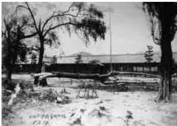
大降雹により被害を受けた田原小学校（昭和8年） （歴史民俗資料館蔵）

この災害により、樹齢千 年ともいわれ、村のシンボルだ った大老松が倒れてしまいま した。その根株は現在、当時 の惨害を忘れないよう地元