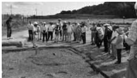
現地説明会のようす

奈良時代の遺構は掘立柱建物で観音堂遺跡10棟、宮ノ前遺跡8棟以上を確認しました。建物の主軸が2種以上あることから時期差があることは確実です。方形の大きな柱穴を持つ建物も