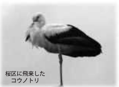
桜区に飛来した コウノトリ