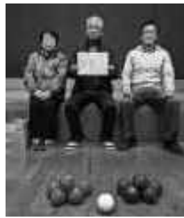
第1位 老太Cのみなさん