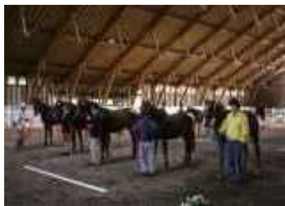
乗用馬市場の前日に開催される共助会

また、馬の生産にも力を入れています。馬の生産と云えば北海道が中心になりますが、遠野は本州で唯一乗用馬のセリが行われています。乗用馬とは、乗馬スクールや馬術大会で騎乗される馬のことです。南部藩の頃より馬文化が根付いていたことで、今でも馬の