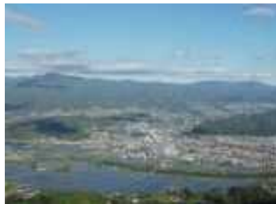
田植え時期の遠野盆地

ていなくとも、親戚が米を作っている場合が多く、米を買ったことが無いという人がたくさんいます。