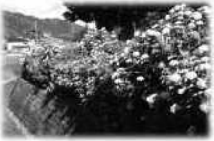
あじさいの小道(板坂区)