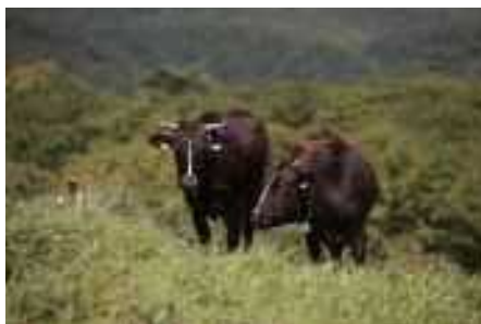
放牧される黒毛和牛

また、馬の生産にも力を入れています。馬の生産と云えば北海道が中心になりますが、遠野は本州で唯一乗用馬のセリが行われています。乗用馬とは、乗馬スクールや馬術大会で騎乗される馬のことです。南部藩の頃より馬文化が根付いていたことで、今でも馬の