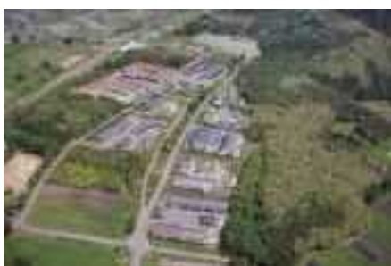
遠野地域木材総合供給モデル基地

遠野市は、総面積の83%を森林が占めており、岩手県内でも有数の林業地です。皆様のお手元に木材が届くまでには、山で伐採する業者、丸太を角材に加工する業者、工務店等の様々な業者が関わっています。これらの関連する11事業体を1か所に集約し、豊富な森林資源の地産地消を推進するため「遠野地域木材総合供給モデル基地」を整備しています。また、伐採後の植栽にも力を入れており、市民参加による植樹イベント「緑化祭」を毎年開催しています。