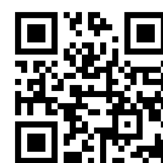
つうえんポータル