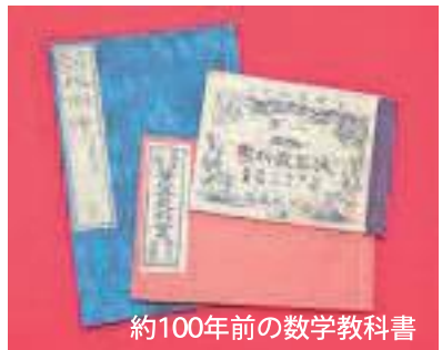
約100年前の数学教科書