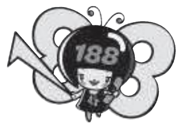
消費者庁 消費者ホットライン188 イメージキャラクター 「イヤナン」

消費生活の相談や問い合わせ、苦情は、神崎郡消費生活中核センターへ (☎22・4977)