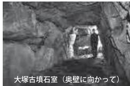
大塚古墳石室 (奥壁に向かって)

※古代の神前郡は、神河町、市川町、福崎町の3町のほか、姫路市香寺町、山田町、豊富町、船津町、砥堀、朝来市生野町を含んだ範囲と考えられています。