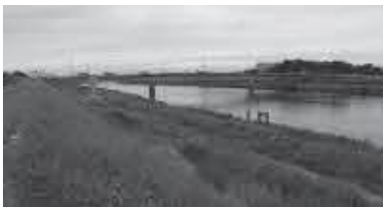
現在の栄橋 (昭和46年に架け替えられたもの)

ところで、そんな通泰も若かりし日に、兄に助けもなかったことがあります。話の内容から養家の家業である医師となるため上京し、大学予