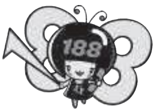
消費者庁 消費者ホットライン188 イメージキャラクター 「イヤヤン」