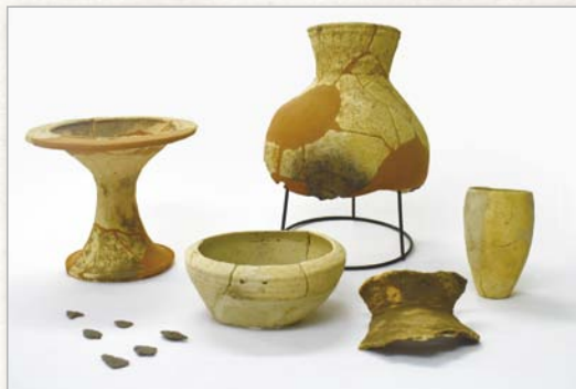
昭和63年・平成12年度調査実施 南田原長目遺跡出土

本展では、平成の30年間に行われた主な発掘調査の成果を紹介します。今、わたしたちの足の下にある遺跡に思いをめぐらせながら、むかしの人々のくらしを見つめてみませんか。