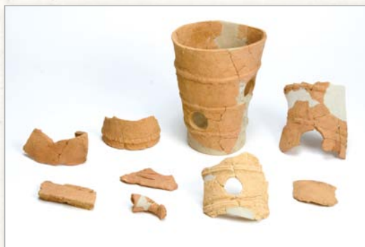
平成16年度調査実施 相山古墳出土