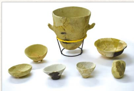
平成23年度調査実施 西治下代ノ下モ遺跡出土