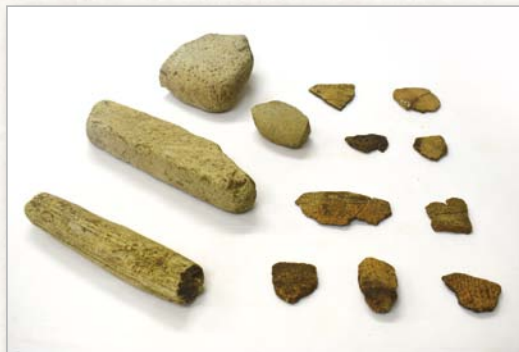
平成4年度調査実施 大門岡ノ下遺跡出土