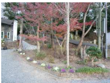
寒い中ありがとうございました

新年を迎える前に、記 念館の周辺ではちよつ とした変化がありまし た。環境整備員の方が記 念館前にある植え込み の剪定や落ち葉掃除、階 段の汚れ落としなどを熱