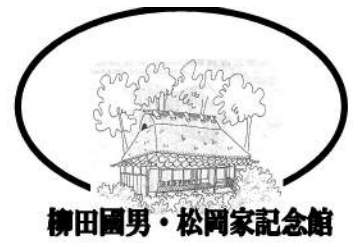
柳田國男・松岡家記念館