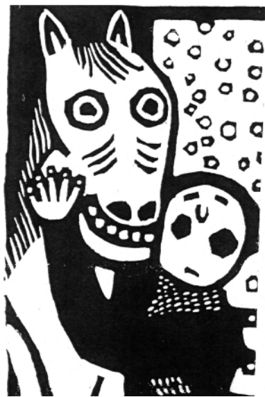
岩田健三郎作「ほほよせて」