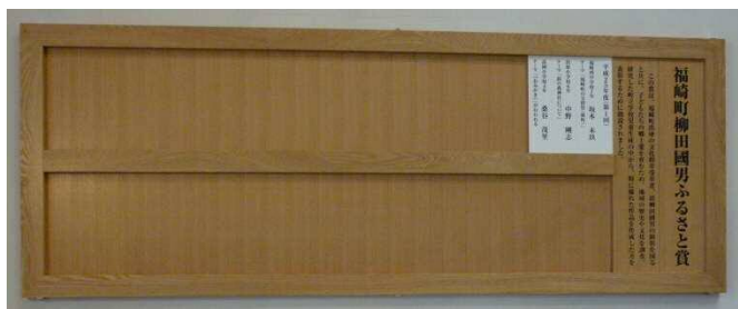
福崎町柳田國男ふるさと賞の掲示板