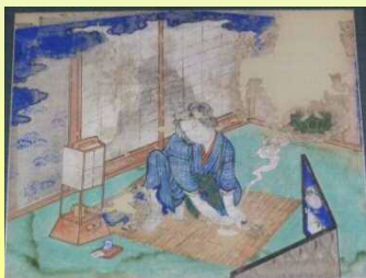
徳満寺の間引きの絵馬

嬰兒を抑えつけているという悲惨なものであった。障子にその女の影絵が映り、それには角が生えている。その傍に地藏様が立って泣いているというその意味を、私は子供心に理解し、寒いような心になったことを今も憶えている」と記しています。