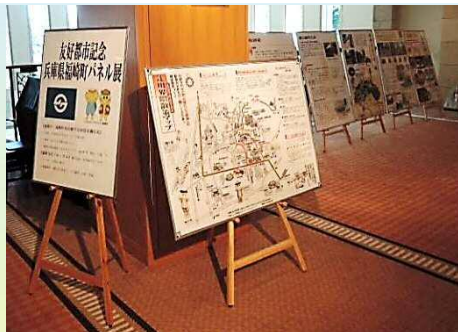
交流ホール前で行った福崎町の展示

福崎町立 柳田國男・松岡家記念館 〒679-2204 神崎郡福崎町西田原 1038の12 電話：0790-22-1000