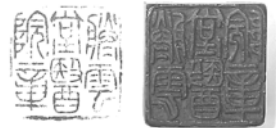
凌雲堂医館章（医院印） （個人蔵）

鼎は、診療だけでなく、正しい病気の予防対策を伝える活動や組織づくりに取り組みました。