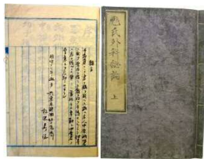
『彪氏外科総論』上と松岡鼎緒言 （当館蔵）

そこで、鼎は、友人から教科書を借りて、ノートに写して勉強をしました。医科大学を目指しました。