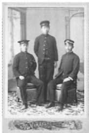
國男・輝夫・静雄

そのことを示すように、兄弟の成長過程をみることができ写真が鼎のもとに遺されています。