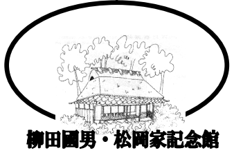
柳田國男・松岡家記念館

福岡町立 柳田國男・松岡家記念館 〒679-2204 神崎郡福岡町西田原 1038-12 電話：0790-22-1000