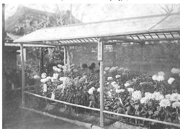
邸宅の菊花壇 明治 42 年 11 月 7 日

通泰が兄の菊づくりを思い詠んだ歌 きくづくりする入みれば世のさがき これに忘れし兄をしぞ思う