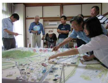
ワークショップのようす

8月8日(土)から12日(水)までの5日間、辻川区公民館で、辻川界隈の町並みを模型にしたジオラマ制作ワークショップを実施しました。ワークショップでは、模型を眺めながら、みなさんの記憶や想いをお聞きしました。それらをプラスチック製の旗に書き込み、模型に立てました。