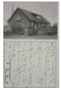
松岡鼎宛柳田國男葉書 大正 8 年 7 月 24 日付