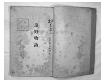
『遠野物語』（明治 43 年）