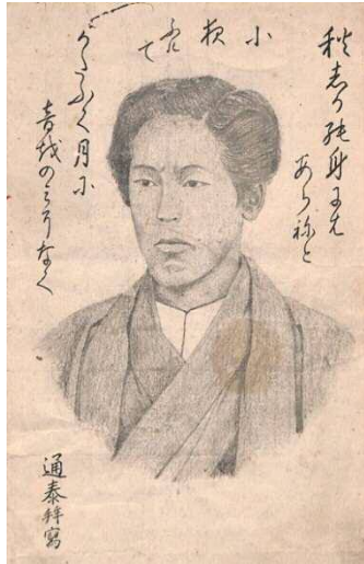
松岡俊次肖像(個人蔵) 俊次の辞世の歌が記されています。