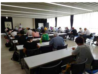
柳田國男検定の受験のようす