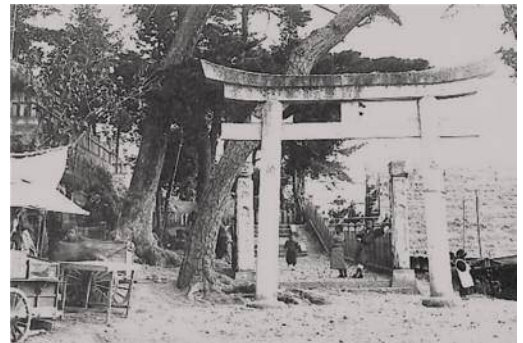
鈴ノ森神社の大玉垣 大正 9 年頃