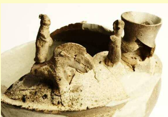
写真1 装飾壺の小像（馬、人物、小壺）