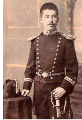
静雄（23歳頃） 明治33年頃