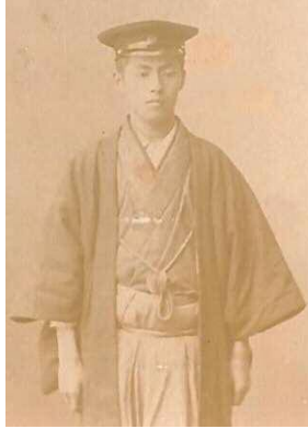
國男（23歳頃） 明治30年頃