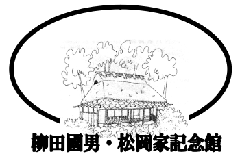
柳田國男・松岡家記念館

会期：11月15日(日)まで 会場：柳田國男・松岡家記念館 休館日：11月2日(月)、4日(水)、 9日(月)